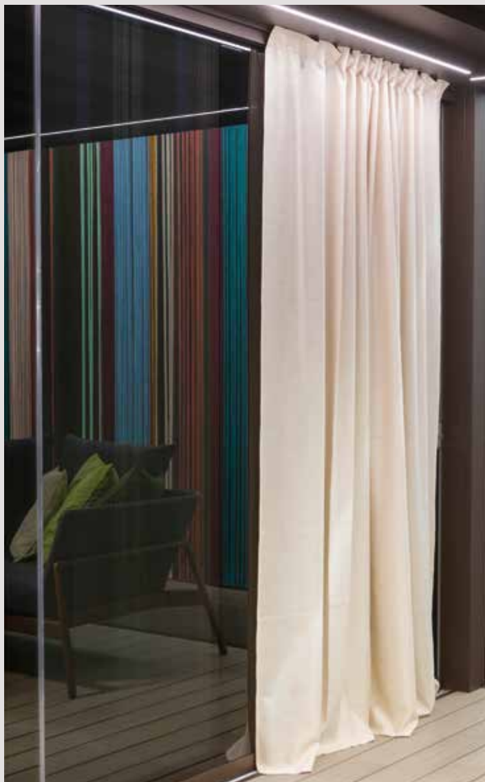
TAILOR-MADE STYLED CURTAINS

ES El accesorio de decoración Mod-Lines , montado en el techo o en la pared, permite configurar a voluntad estantes de cristal, cajones y módulos abiertos, personalizables en color y con LED. Drapes es la colección de cortinas ornamentales de estilo sastre confeccionadas con un tejido suave y elegante en diferentes colores.