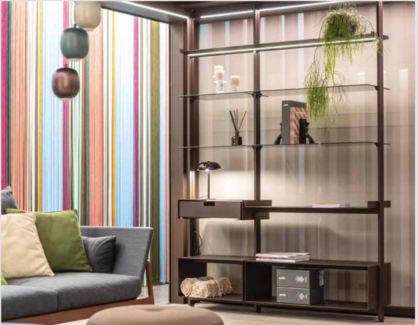
MOD-LINES WITH LED LIGHTS