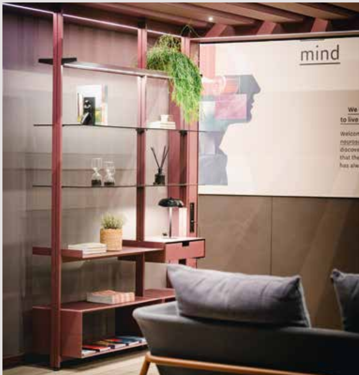
WALL OR CEILING MOUNTABLE